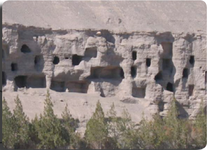
La grotte de Dunhuang où le manuscrit d' Īrqa Bitig fut retrouvé en 1907.