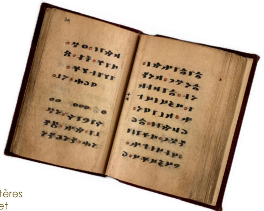
Le manuscrit original, écrit en caractères runiques turk-anciens, un alphabet aujourd'hui disparu.